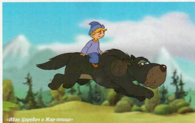
«Иван Царевич и Жар-птица»

фильма позаимствовали у «Конька-Горбунка» Петра Ершова. Совместили ее с народной сказкой про Ивана Царевича и Серого Волка. Добавили героев из разных народных и литературных русских сказок, и получилась веселая история для детей и