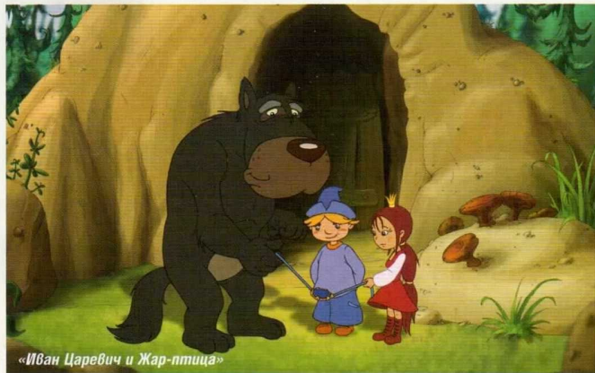
«Иван Царевич и Жар-птица»

взрослых - о дружбе, любви, коварстве и великодушии.