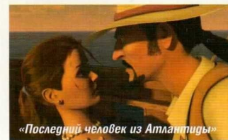
«Последний человек из Атлантиды»

которым наша студия трудится в данный момент, - это новое прочтение любимой ребятишками всего мира сказки Ганса Христиана Андерсена. А наш «Иван Царевич» - это добрая пародия на самые популярные литературные и народные русские сказки, которые в равной степени обожают как дети, так и их родители».